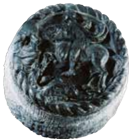
◀ Clef de voûte Ecole génoise 16 e siècle Ardoise de Lavagna MEC.56.13.63

Parmi les nombreux lieux emblématiques du patrimoine de la Corse, le Palais des gouverneurs, aujourd'hui musée de Bastia, tient incontestablement une place singulière. Il se trouve au cœur de la citadelle de Bastia, dans ce quartier de Terra Nova créé par des Génois à la fin du 14 e siècle.